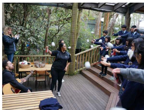
~ Willowbank ~

現地校での最終日、お世話になったホストファミリーを学校に招いてのお別れパーティー