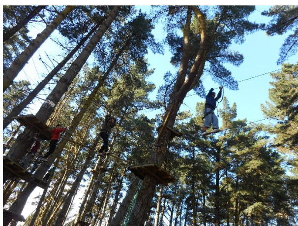
~ Adrenalin Forest ~

期間中、2日間順天生だけの遠足がありました。Adrenaline forest では6つのレベルに分かれたアスレチックがあり、命綱を頼りに樹と樹の間を渡っていきます。中には地上20mの高さに相当するところもあります。Willow Bank では絶滅危惧種であるキウイをはじめとする、たくさんのニュージーランド特有の鳥や動物たちに会うことが出来ました。また、ニュージーランドの先住民のマオリ文化に触れる貴重な体験ができました。