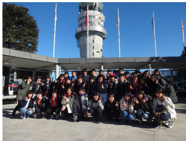
～クライストチャーチ国際空港～

8月3日から8月22日まで、35名の生徒がニュージーランド研究旅行に参加しました。オークランド空港で飛行機を乗り換えをし、合計12時間のフライト後、Kaiapoi High School と Rangiora New Life School に分かれ、ホストファミリーに引き取られた後、週末をホストファミリーと共に過ごしました。月曜日からはバディと同じクラスに入り、数学や英語の他にも演劇などの順天高校にはない授業を体験することが出来ました。